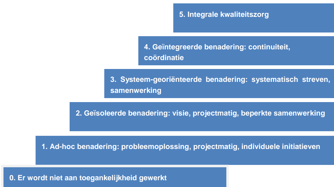
Figuur 2. Ontwikkelingsladder

Het ISEMOA-KZS is niet normatief. De regionale overheid dient een actieve rol op te nemen bij het onderzoeken en beoordelen van de kwaliteit van haar werk rond toegankelijkheid en dit volgens de 16 elementen. Daarna dient zij zelf te bepalen hoe veranderingen in sommige van die elementen het werk rond toegankelijkheid ten goede kan komen. Net zoals bij andere kwaliteitszorgsystemen wordt er gewerkt met een ontwikkelingsladder. Die ontwikkelingsladder wordt gebruikt als een beoordelingsmechanisme om het ontwikkelingsniveau van de regionale overheid op aan te duiden. Er worden zes ontwikkelingsfasen onderscheid (Figuur 2):